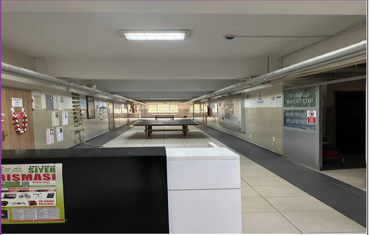
Koridor (1. Kat)