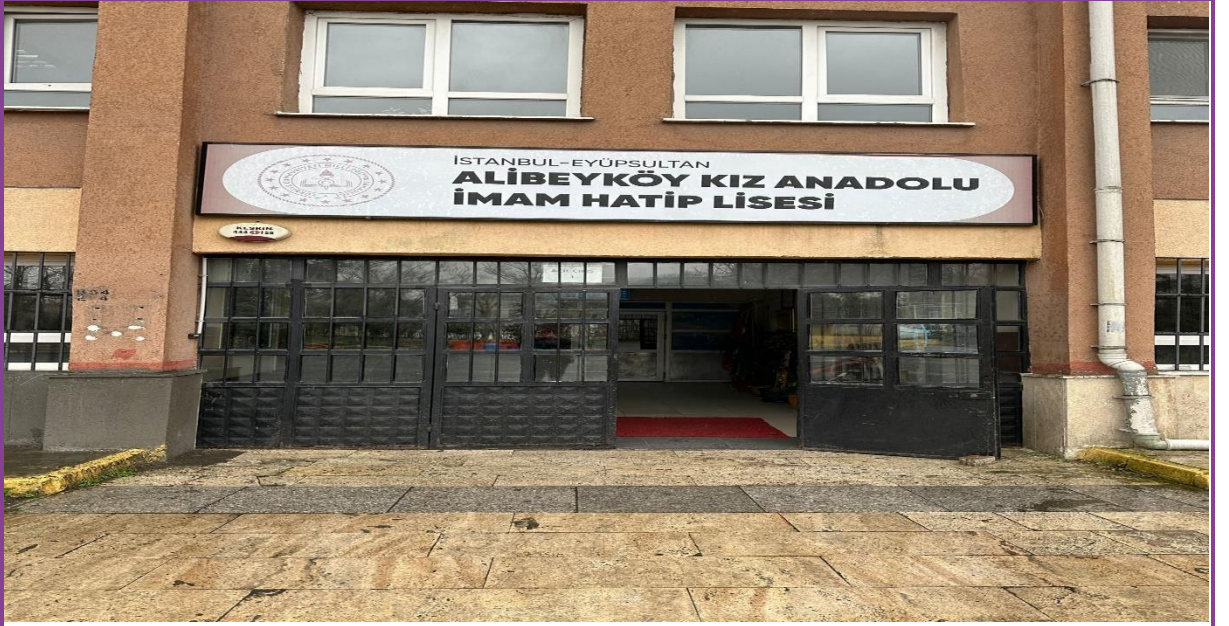
Bina giriş kapısı sonrası hol