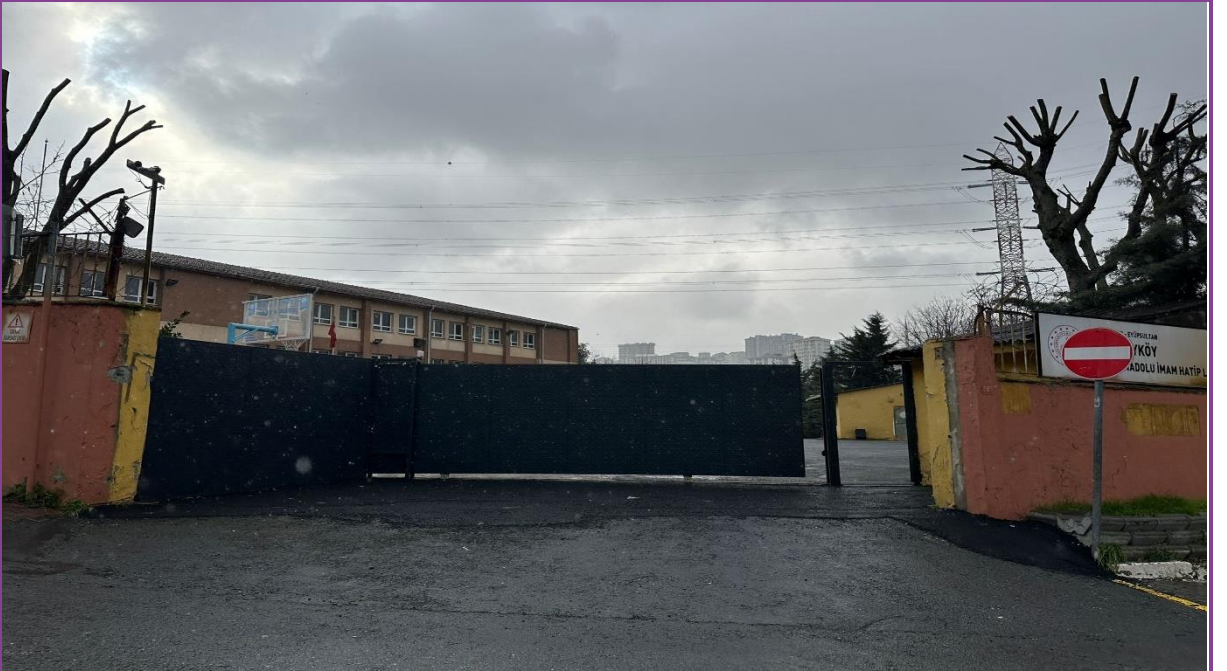
Bina giriş kapısı dışarıdan