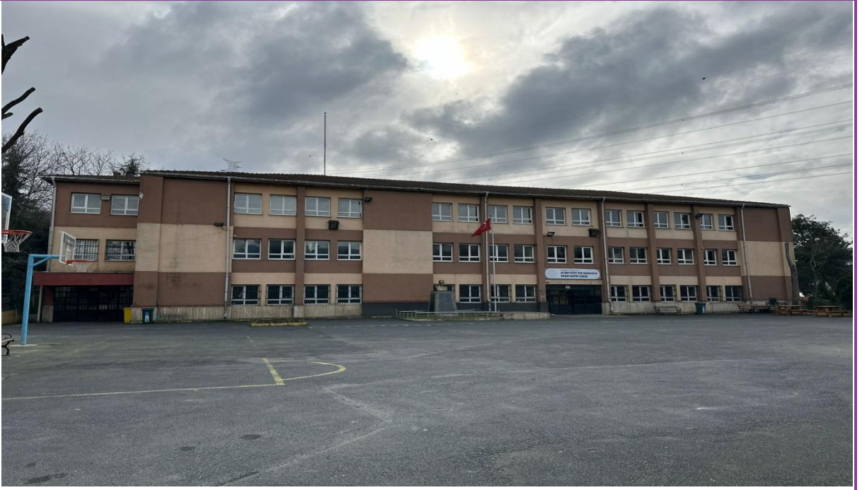
Bahçe kapı girişinden okulun görünümü