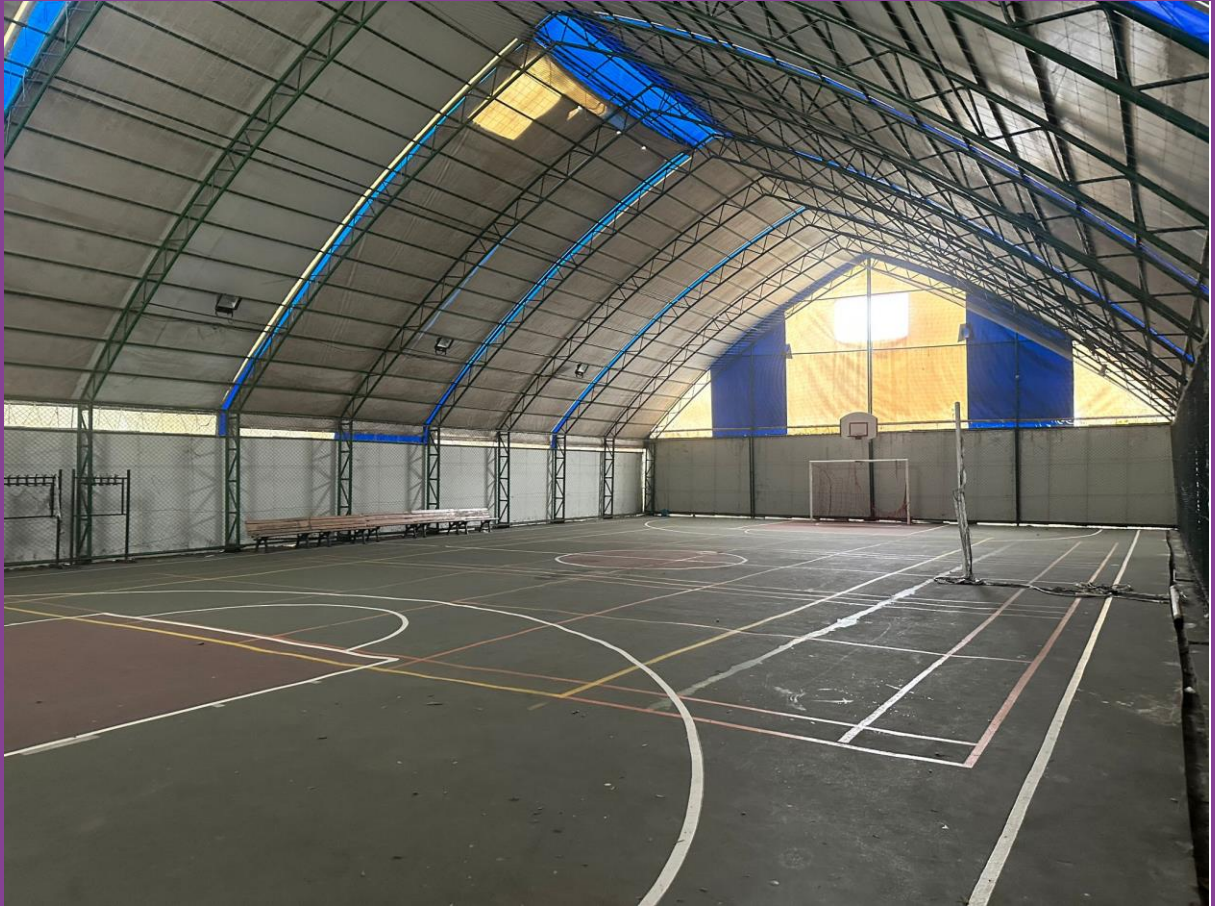
Spor salonu (Dış)