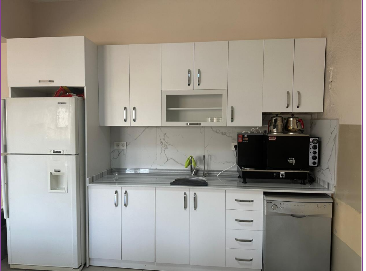
Mutfak/ çay ocağı