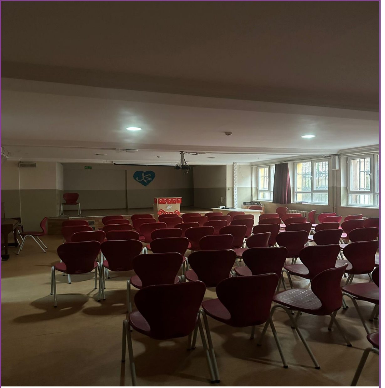
Çok amaçlı salon