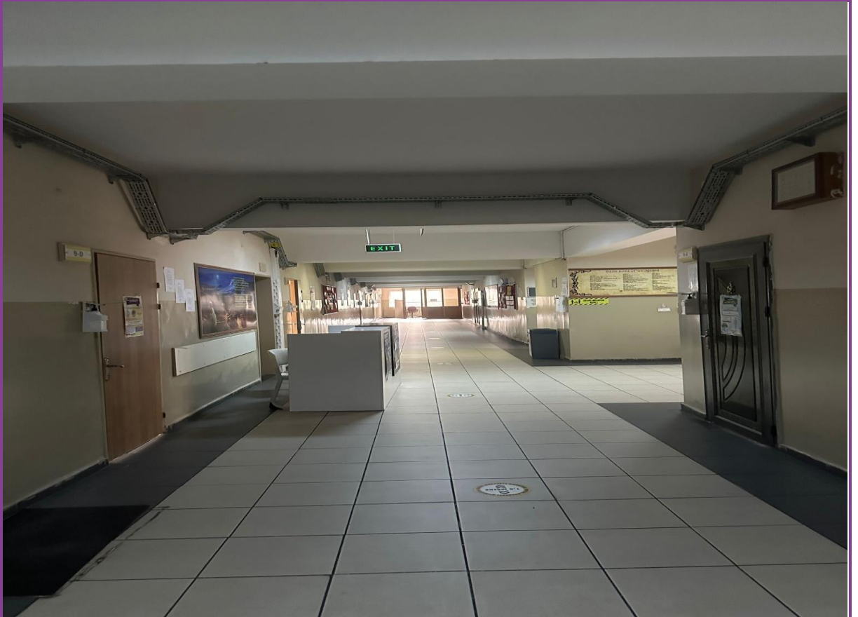
Koridor (3. Kat)