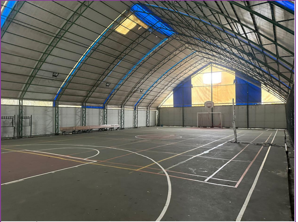
Spor salonu (İç)